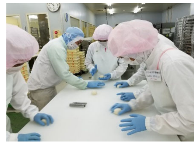
การแปรรูปอาหาร