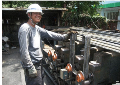
สถาปัตยกรรม