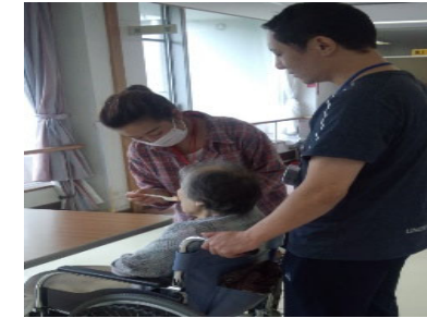
การดูแลพยาบาล

สหกรณ์ธุรกิจสีเขียวถูกนำเข้ามาและจดทะเบียนเป็นองค์กรกำกับดูแลและองค์กรสนับสนุนที่จดทะเบียน