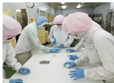
การแปรรูปอาหาร