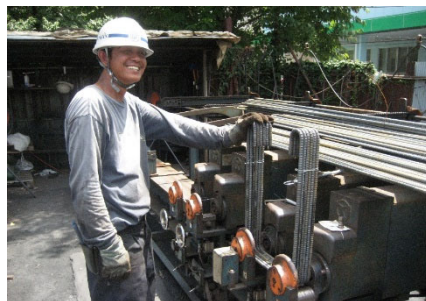
สถาปัตยกรรม